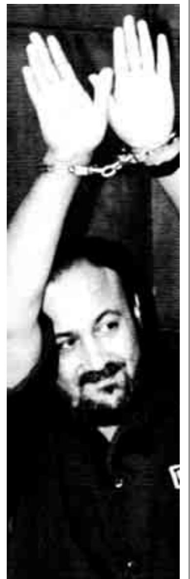
Un appello per sostenere la Campagna per la liberazione di Marwan Barghouti e il prigioniero palestinese