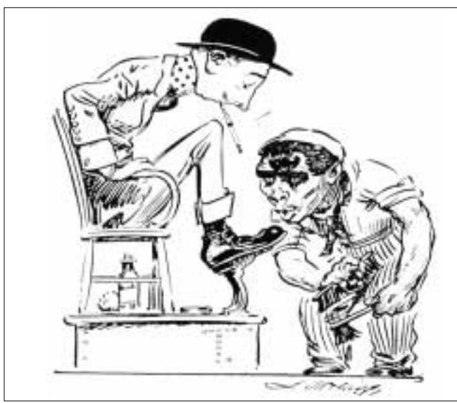
"Homo Italicus" Historical Pictures Service, Chicago. Da "L'Orda, Quando gli albanesi eravamo noi", G. A. Stella, Edizioni Rizzoli

dentale, per una violazione amministrativa paga al massimo una multa, un migrante finisce al Cpt. Persino la convalida del giudice («entro 48 ore», nel caso di provvedimento provvisorio) è in sostanza omessa. La documentazione viene infatti inviata a un giudice e poi convalidata, ma nessun migrante compare in un tribunale e in sostanza l'operazione è puramente amministrativa. Oltre a fare carta straccia del principio dell'habes corpus, l'esistenza dei centri di permanenza temporanea è contestata da una terza obiezione, stavolta del tutto pratica. I Cpt, secondo il trattato di Schengen, servivano infatti fondamentalmente ad arginare i flussi migratori, provvedere ad una identificazione dell'immigrato irregolare e infine procedere al rimpatrio. «Invece non funzionano», insiste Catania. «Non svolgono le funzioni per cui erano previsti, al contrario peggiorano la situazione e contribuiscono a spingere gli immigrati nella zona d'ombra dell'irregolarità». «Le statistiche non mentono e oggettivamente i flussi migratori sono aumentati in questi anni, conseguenza diretta all'aumento delle guerre e delle tensioni internazionali». Stesso discorso sulle funzioni di riconoscimento, dal momento che pochissimi, tra quelli che entrano nei Cpt con la prospettiva comunque di essere buttati fuori, forniscono le loro reali generalità o la provenienza. Secondo i promotori della Campagna