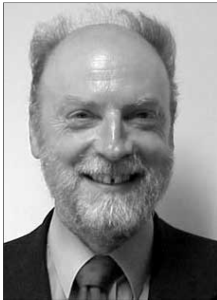
Francis Wurtz, insegnante, è funzionario del Partito comunista francese (Pcf) dal '73 e membro della direzione nazionale dal 1979. Responsabile della sezione internazionale del Pcf dal '92 al 1999, è eurodeputato dal 1979. Dal 1999 è il presidente del del gruppo confederale della Sinistra unitaria europea/Sinistra verde nordica (Gue-Ngl) del Parlamento europeo. Per dieci anni è stato anche vicepresidente della commissione per lo sviluppo dello stesso Parlamento (1989-99)

(ride) No, direi che è possibile perché il Gue-Ngl ha una identità che va al di là della somma dei partiti che lo compongono. Partiamo dal grande elemento comune che ci unisce: un mondo più equo e le aspirazioni a un cambiamento anti-liberista, cosa che perseguiamo tutti i giorni nelle istituzioni con una visibilità più moderna possibile. Noi lasciamo poi la libertà a tutti i partiti, su questioni specifiche, di conservare la propria identità; ci mancherebbe. Naturalmente alla base deve esserci