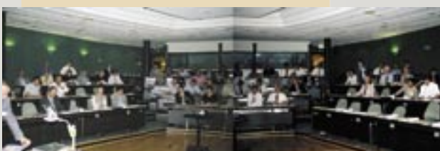
Konferanser og medlemsmøter