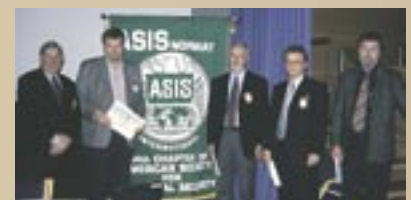
Utdeling av medlems-sertifikater