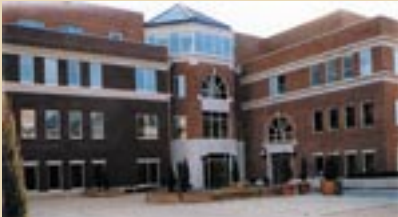
Hovedkvarteret i Alexandria, USA

ASIS har sin opprinnelse i USA og ble grunnlagt i 1954. ASIS er en internasjonal organisasjon – ASIS International – med egne organisatoriske enheter i en rekke land. ASIS International ledes fra hovedkvarteret i Alexandria, USA.