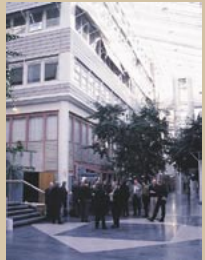
Medlemmene samlet hos IBM